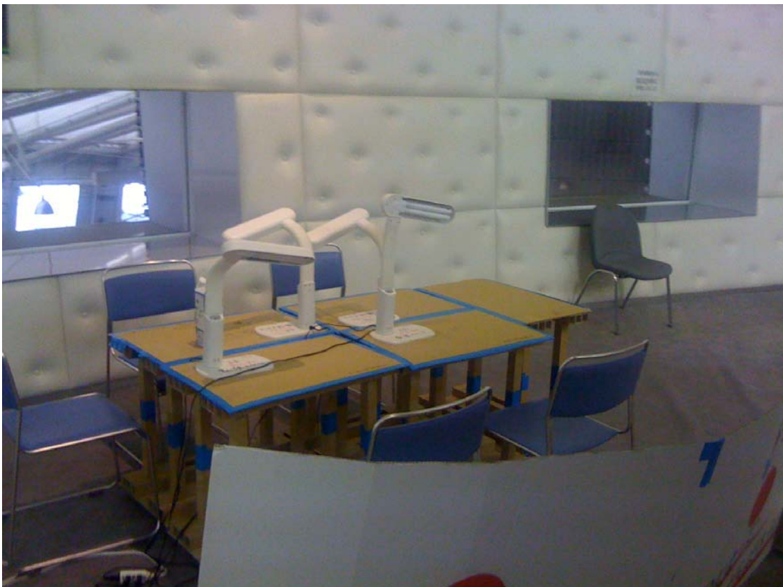
廊下にある夜間の子供たちの勉強机です。