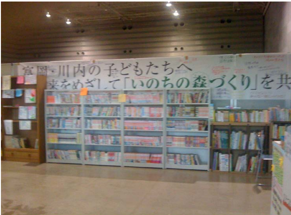
子供たちの図書コーナー