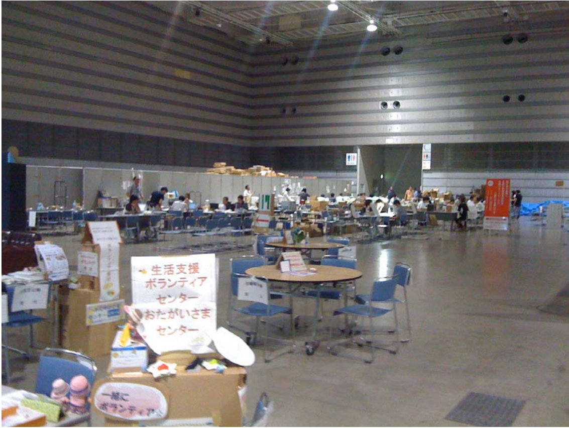
ボランティアセンターも閑散としてきました