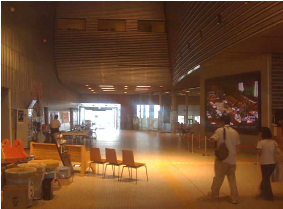
ホールで国会が中継されていますが、誰も見ていません。