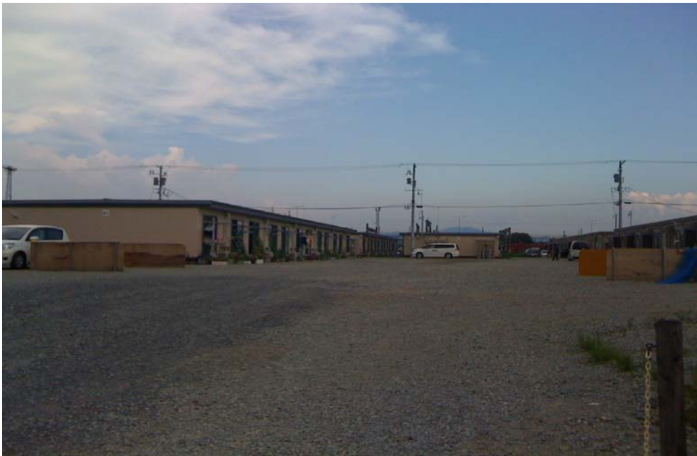
夕方の仮設住宅（ビッグパレットのとなりです）