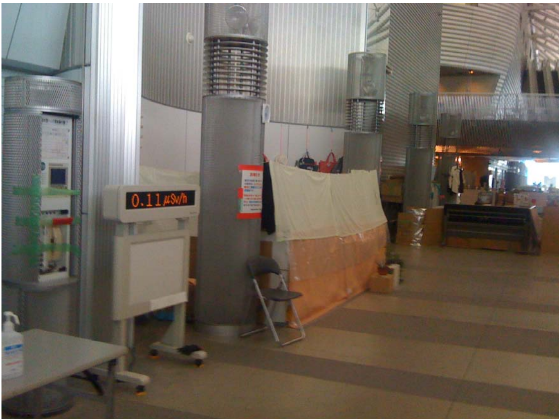
なんと入口に放射能測定装置 現在 0.11 マイクロシーベルト/h です。