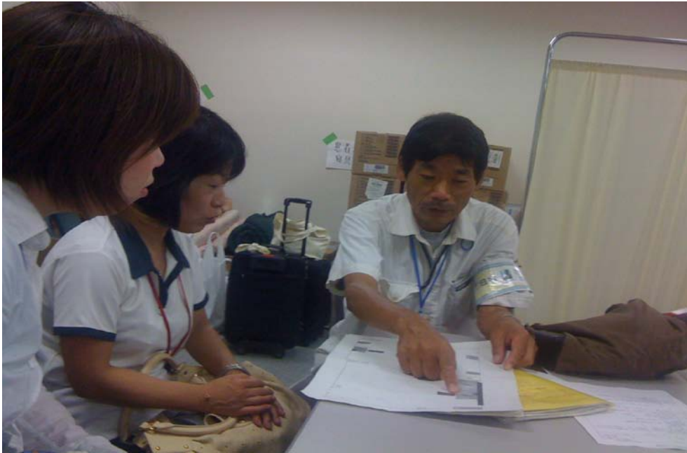
初日のオリエンテーション中。真剣です。