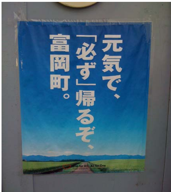
臨時の町役場のポスターです。