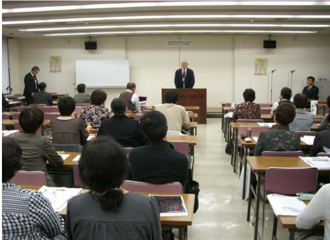
御来賓の参議院議員 衛藤 晟一様のご挨拶