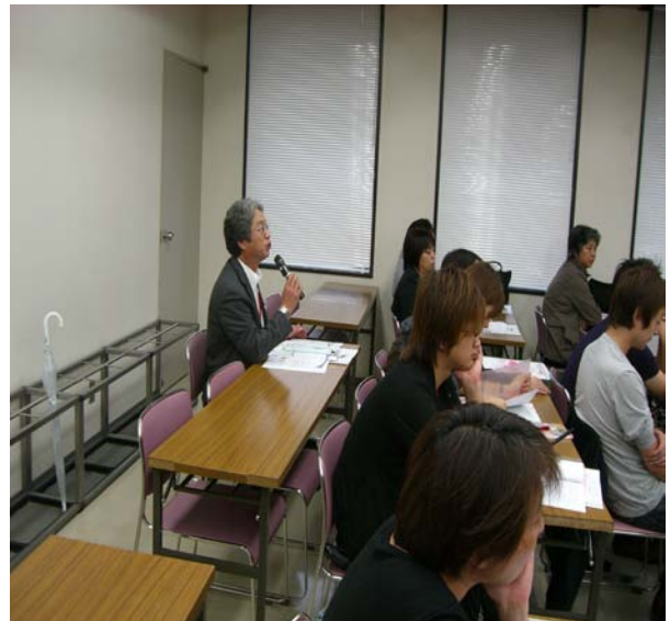
福島県支部 大堀支部長発言