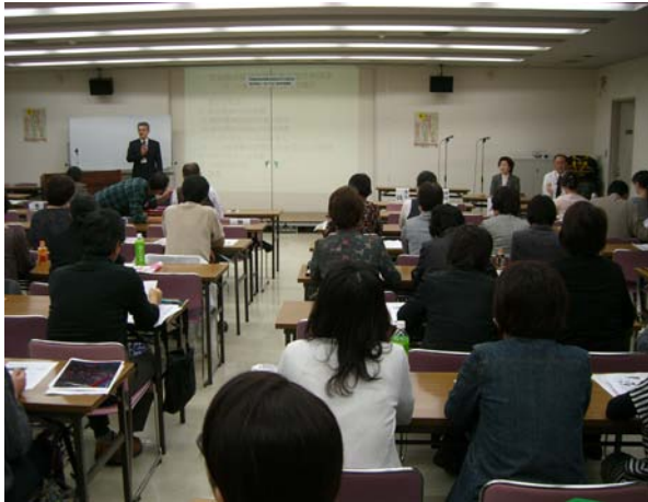
シンポジウム開始前