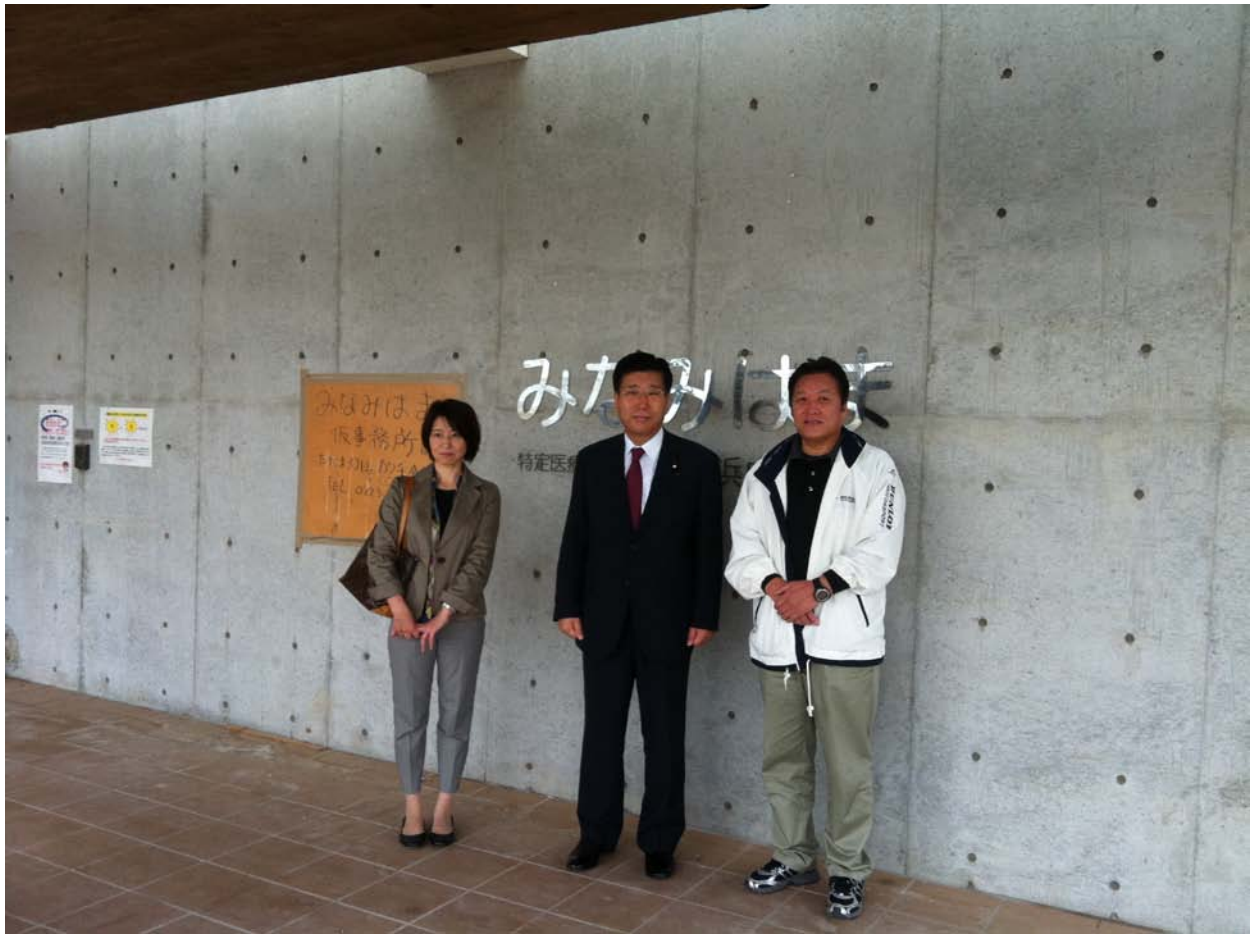
衛藤議員と菅野事務長、相澤看護就任の3名