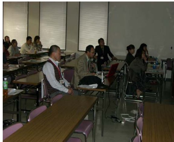
宮城県支部 森支部長発言